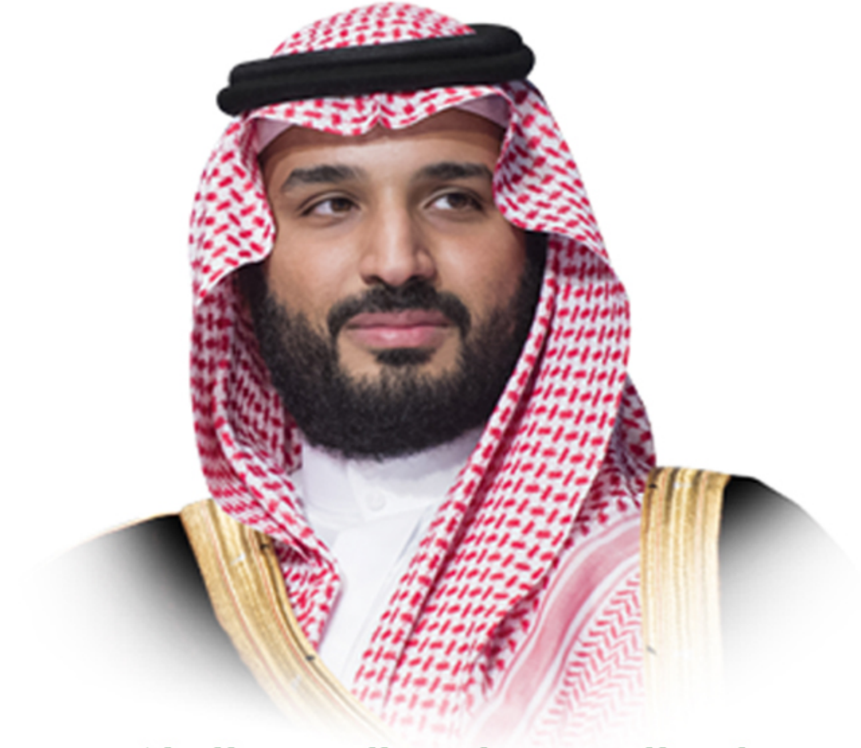
ولي العهد صاحب السمو الملكي الأمير محمد بن سلمان بن عبد العزيز آل سعود

يسعدني أن أقدم لكم رؤية الحاضر للمستقبل التي نريد أن نبدأ العمل بها اليوم للغد بحيث تعبر عن طموحاتنا جميعا وتعكس قدرات بلادنا