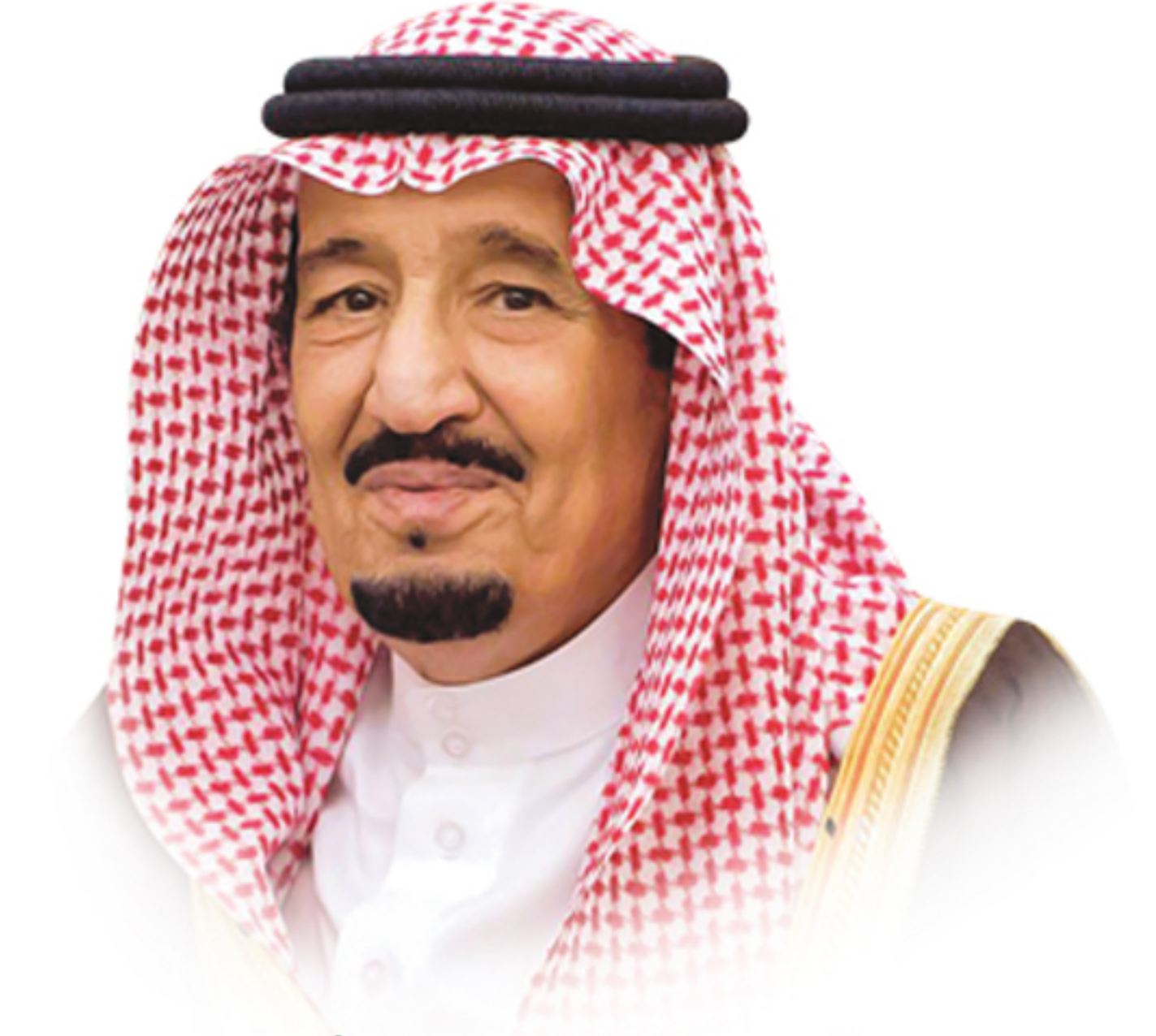
خادم الحرمين الشريفين الملك سلمان بن عبد العزيز آل سعود

هدفني الأول أن تكون بلادنا نموذجا ناجحا ورائدا في العالم على كافة الأصعدة وسأعمل معكم على تحقيق ذلك